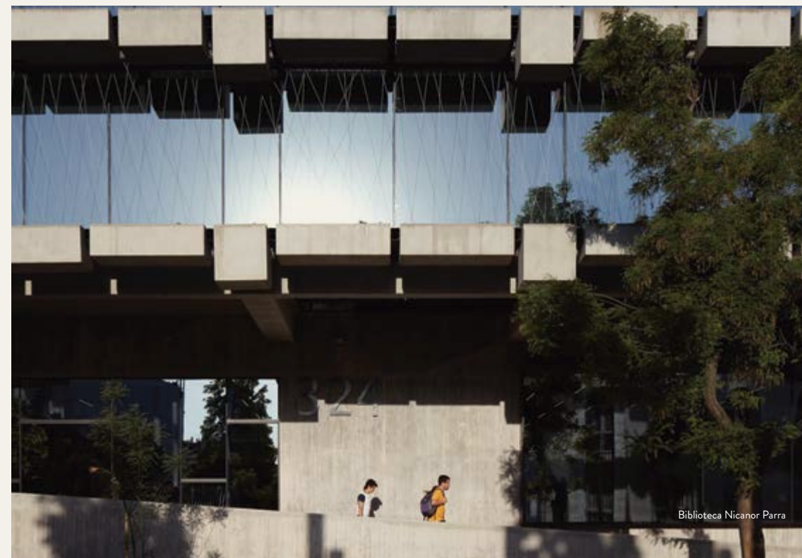
Biblioteca Nicanor Parra

Es un edificio sustentable con el medio ambiente, cuyas características lo han hecho merecedor de reconocimientos