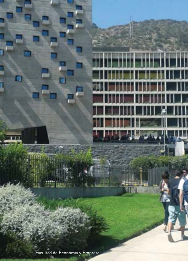
Facultad de Economía y Empresa

Gracias a su equipo de trabajo proveniente del mundo académico, público y empresarial, el Centro Asia - Pacífico (CEAP) ha logrado consolidarse como un centro de excelencia en los ámbitos de la docencia, investigación y extensión en las áreas de comercio y negocios entre las orillas asiáticas y latinoamericanas del Pacífico.