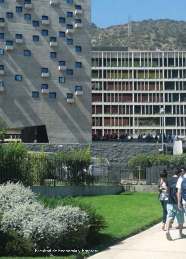
Facultad de Economía y Empresa

Gracias a su equipo de trabajo proveniente del mundo académico, público y empresarial, el Centro Asia - Pacífico (CEAP) ha logrado consolidarse como un centro de excelencia en los ámbitos de la docencia, investigación y extensión en las áreas de comercio y negocios entre las orillas asiáticas y latinoamericanas del Pacífico.